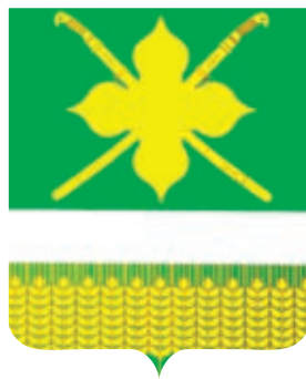
Кирпильское СП ГРР РФ - № 8058