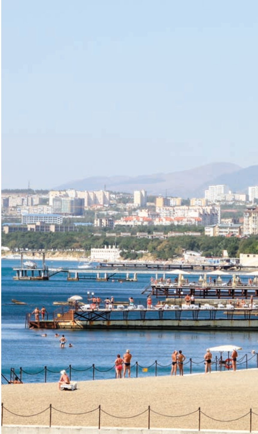
В этом году Кубань могут посетить около 13 миллионов отдыхающих. Некоторые гостиницы уже полностью забронированы до ноября 2015 года