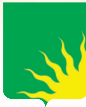
Восточное СП ГРР РФ - № 9913