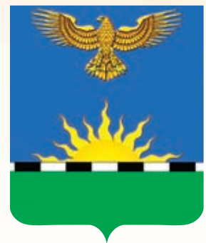
Двубратское СП ГРР РФ - № 8421