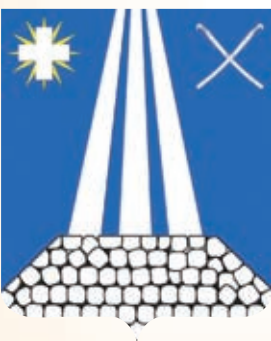
Некрасовское СП ГРР РФ - № 9336