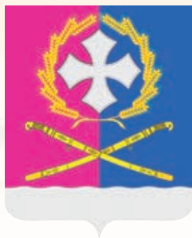
Воронежское СП ГРР РФ - № 7874