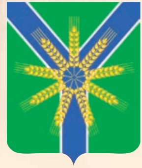
Братское СП ГРР РФ - № 9096