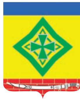
Ладожское СП ГРР РФ - № 8423