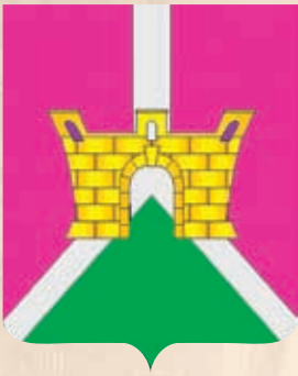
Усть-Лабинский район ГРР РФ - № 1916