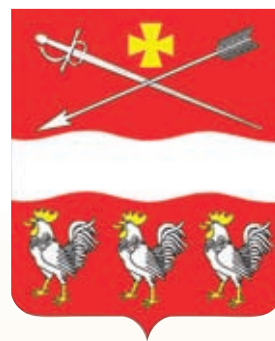
Суворовское СП ГРР РФ - № 9915