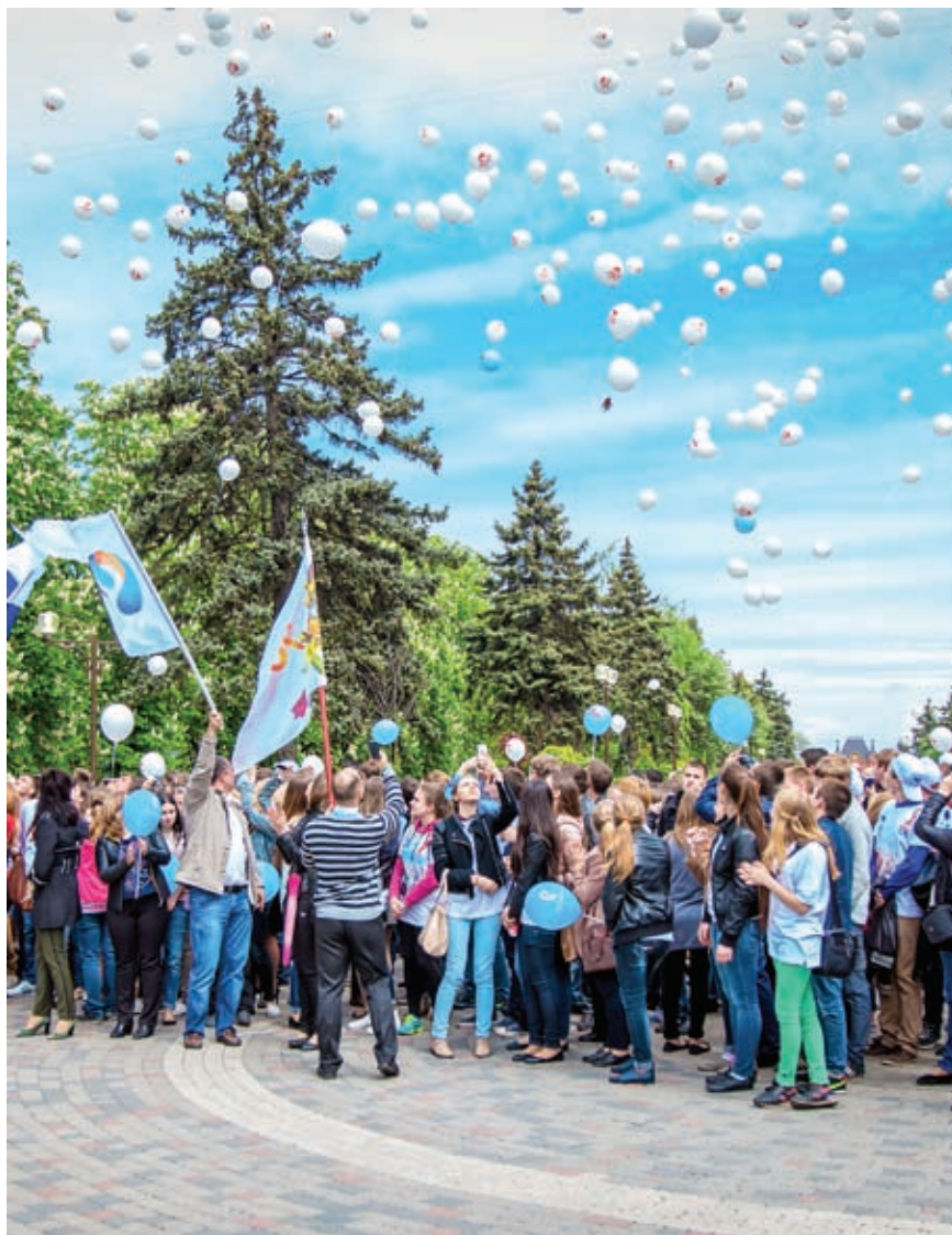
На Кубани акция «70. Спасибо за мир!» проходила в трех городах – Краснодаре, городе-герое Новороссийске и Армавире

На Кубани акция «70. Спасибо за мир!» проходила в трех городах – Краснодаре, городе-герое Новороссийске и Армавире. ■