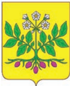
Джумайловское СП ГГР РФ - № 7363