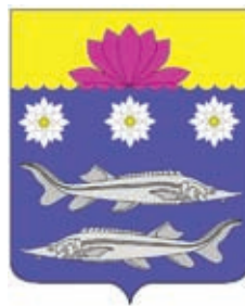
Гривенское СП ГГР РФ - № 6574