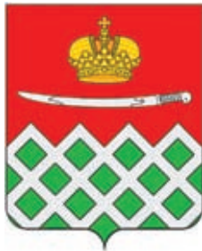
Новониколаевское СП ГГР РФ - № 7231