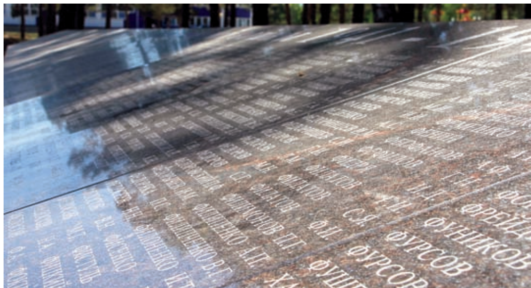
Установили новые мемориальные каменные плиты, на которые нанесли около 30 тысяч имен погибших в годы Великой Отечественной войны абинских солдат и партизан. Отреставрирован ряд мемориальных плит на местах братских захоронений