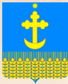
Успенское СП ГГР РФ - № 7616