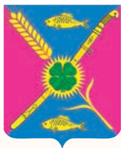
Привольненское СП ГГР РФ - № 7622