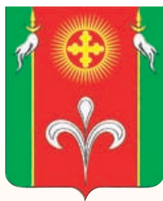
Стародеревянковское СП ГГР РФ - № 9895