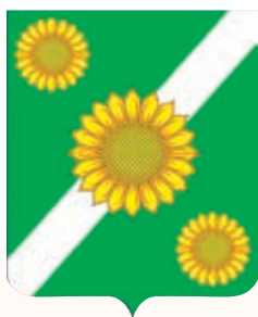
Придорожное СП ГГР РФ - № 7624