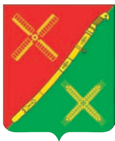
Красногвардейское СП ГГР РФ - № 7866