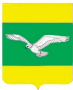
Кубанскостепное СП ГГР РФ - № 8413