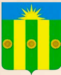
Новопавловское СП ГГР РФ - № 6990