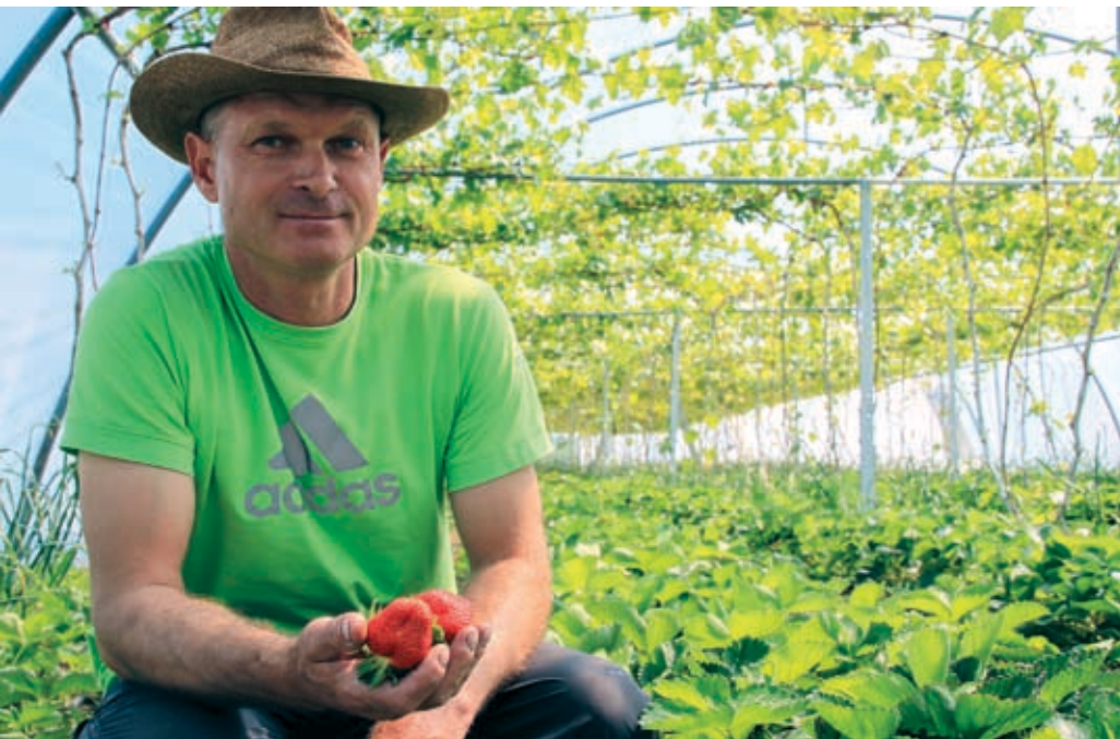
Помимо янтарной ягоды в теплицах растут клубника, малина и чеснок. Все эти фрукты и овощи фермер выращивает с 2008 года

люди. Не побоюсь сказать, что на них многое держится. С активистами мы никогда не расстанемся. Даже если многим из «старейшин» приходится в силу возраста и здоровья уступать место молодым, сами они все равно остаются в рядах ТОС, просто переходят на должности почетных консультантов, – отметил и. о. главы поселения.