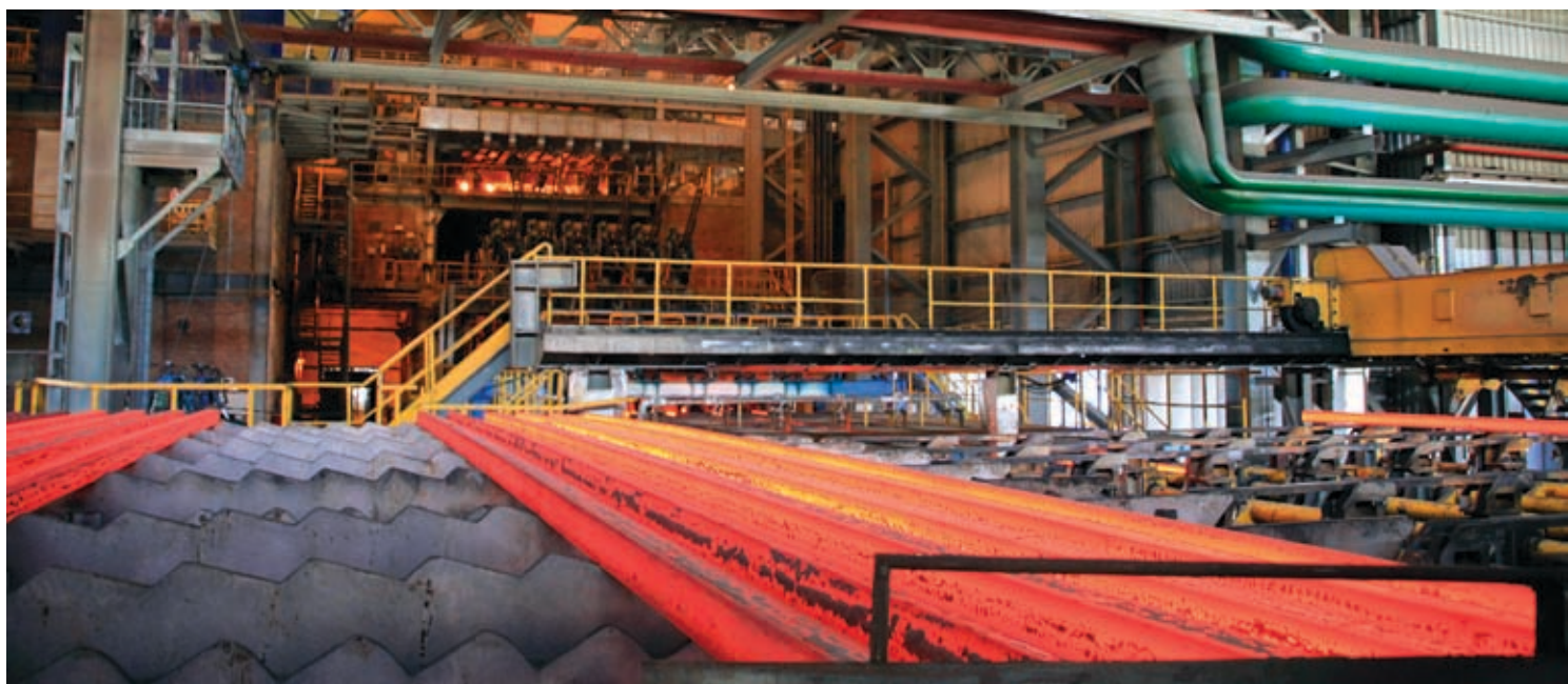
Абинский электрометаллургический завод, помимо важнейшей общероссийской задачи – успешного развития производства, решает огромное количество социальных вопросов местного значения

– Несмотря ни на что, мы отмечаем высокие темпы строительства жилья. В город заходят строительные компании и возводят жилые комплексы. Если строят, значит, есть спрос. Эти сторонние предприятия быстро получают ▶