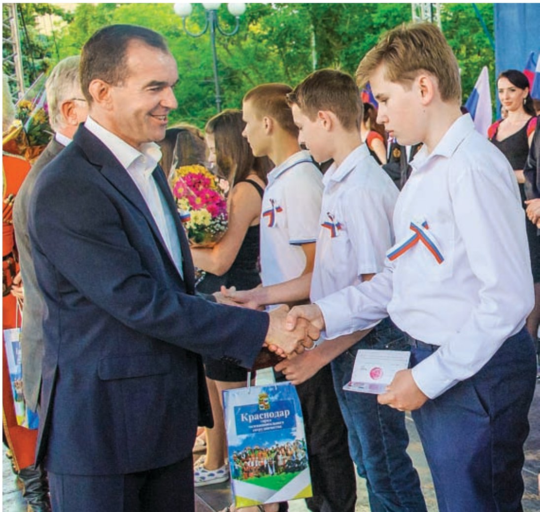
По традиции в День России школьникам, принимающим активное участие в общественной жизни города, вручили паспорта. Свой главный документ из рук руководителя региона получили 13 краснодарских учеников

В Кремле прошло заседание Совета министров иностранных дел государств – членов Шанхайской организации сотрудничества (ШОС). На встрече обсуждались ключевые вопросы деятельности ШОС в свете председательства России в организации в 2014–2015 годах.