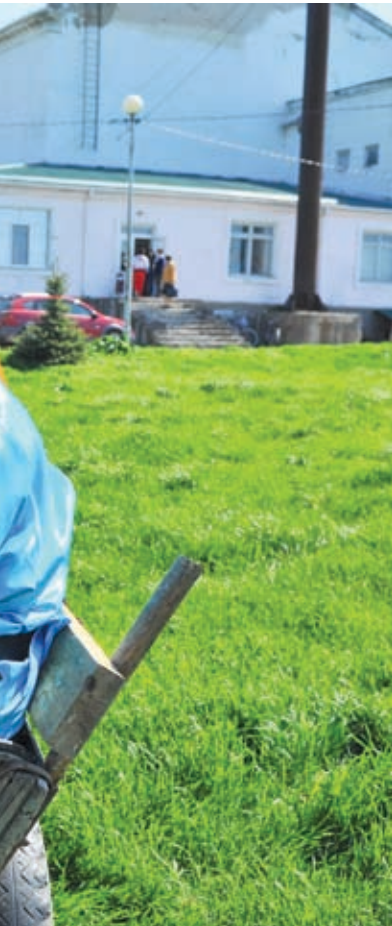
После молебна гости собрались у входа в Дом культуры и стали рассаживаться по подводам

ринной казачьей песни «Казачья вольница» из города Пролетарска Ростовской области. – Познакомились с ним на нашем ростовском межрегиональном православном фольклорном фестивале «Рождество Христово», после которого уже он пригласил нас на Кубань – принять участие в фестивале под названием «Маргоски». Слово это было нам не известно, суть тоже не ясна, но перспектива заинтересовала. Приехав, мы были просто потрясены – как ярко и красочно прошел праздник, как душевно встречали нас жители. Сама задумка чудесна – возрождение былых традиций, которые составляли основу жизни отдельно взятой станицы. Это уникально и достойно восхищения. Поэтому сегодня мы ехали сюда с большим воодушевлением.