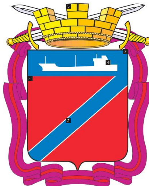
Большой (полный) герб Туапсинского городского поселения