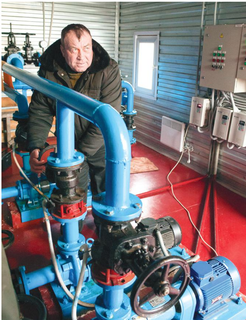
Сегодня в поселении идет беспрецедентная деятельность по обновлению системы водоснабжения

► ет подаваемого топлива. Но это уже работа не над количеством, а над качеством.