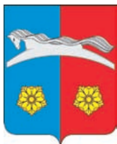
Шабановское СП ГГР РФ – № 6792