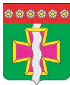
Афипское СП ГГР РФ – № 6373