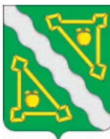
Григорьевское СП ГГР РФ – № 6460