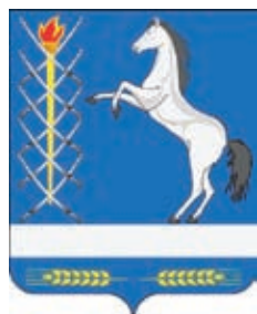
Лосевское СП ГГР РФ – № 3941