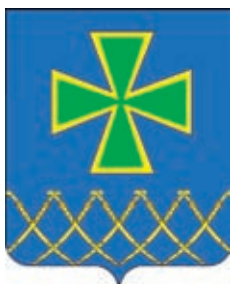
Казанское СП ГГР РФ – № 3614