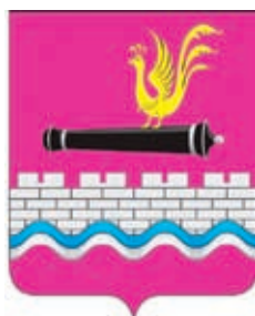
Смоленское СП ГГР РФ – № 6800