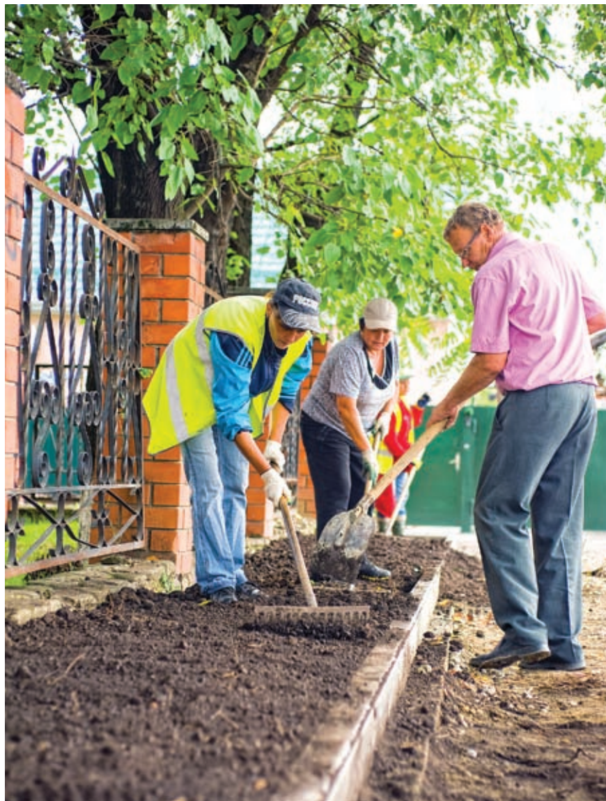
Поселение третий год подряд участвует в краевом конкурсе на звание «Самый благоустроенный город, станица Кубани» и занимает одно из призовых мест

Хотелось бы отметить, что кинотеатр «Мир» по праву считается гордостью и поселения, и района. Он отвечает всем современным требованиям кинопроката, в нем созданы необходимые условия и для зрителей, и для работы сотрудников.