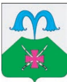
Азовское СП ГГР РФ – № 6462