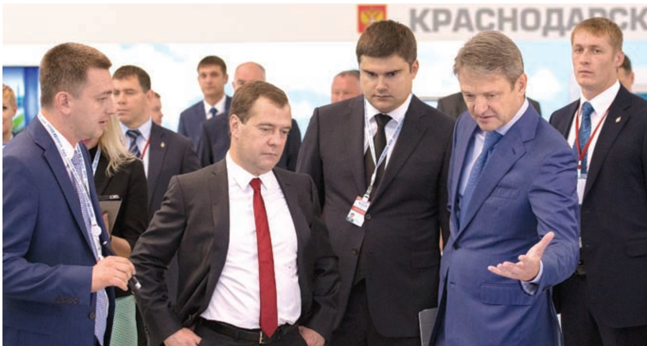
На Играх впервые будет использоваться так называемый паспорт болельщика, то есть аккредитация для тех зрителей, у которых будут билеты. Два центра уже работают – в Москве и Сочи

– Мы в течение четырех лет отбирали коллективы со всей страны в рамках культурной олимпиады. Ее финал состоится именно в Олимпийском парке, вот на этой площади празднования. К нам приезжает более 4 тысяч различных артистов, 160 коллективов из всех регионов нашей страны, которые как раз гостям Игр будут показывать наше культурное многообразие, – отметил Дмитрий Чернышенко.