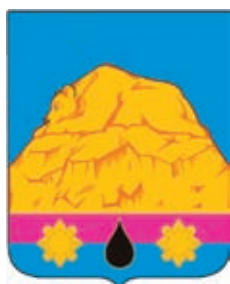
Ильское СП ГГР РФ – № 6786