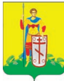
Дмитриевское СП ГГР РФ – № 4496