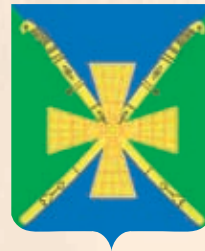
Новоджерелиевское СП ГГР РФ - № 10269