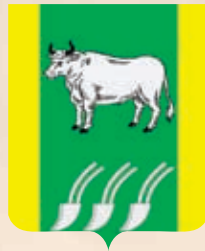
Большебейсугское СП ГГР РФ - № 10350