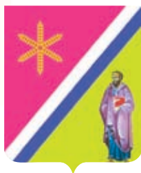
Павловское СП ГГР РФ - № 8154