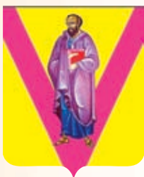
Павловский район ГГР РФ - № 2914