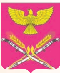
Новопетровское СП ГГР РФ - № 10287