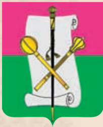
Брюховецкий район ГГР РФ - № 2743