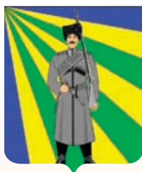
Новопластуновское СП ГГР РФ - № 5624