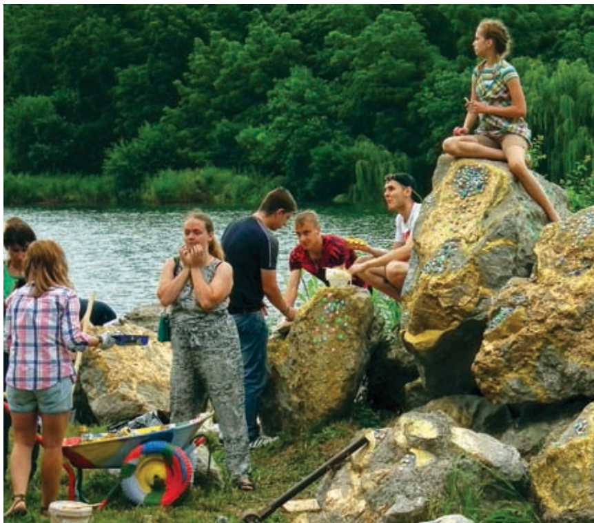
Все больше появляется равнодушных к своему городу людей. Жителей волнует все – от состояния ливневой канализации до наличия парковых зон

В ходе последующих субботников накал активности только повышался. Число участников мероприятий росло: к творческим встречам присоединились волонтеры, студенты, представители ТОС, а также активисты многих городских сообществ. К примеру, свою готовность выразило и сообщество вегетарианцев Краснодара, для которых вопрос защиты окружающей среды является одним из актуальных.