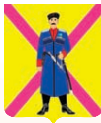
Среднечелбасское СП ГГР РФ - № 6662