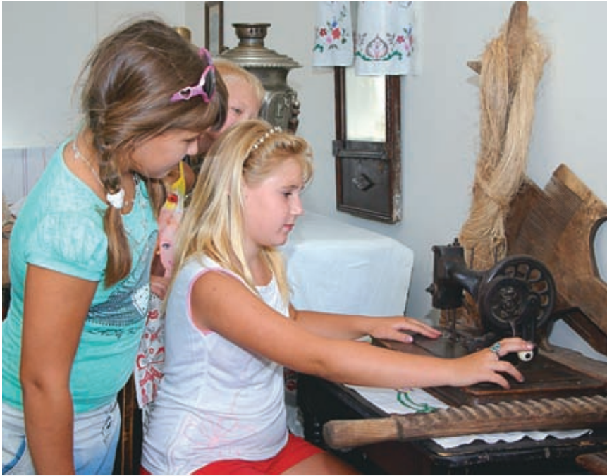
История, как стена из кирпичиков, складывается из человеческих судеб. Время меряется отдельными жизнями

ской компании для промышленного разведения конских табунов. Цены на землю были минимальными. Аренда десятины на год оценивалась в двадцать копеек. В договоре была лазейка, которой и воспользовались предприниматели. Компании разрешалось сеять столько хлеба, сколько было необходимо для прокормления ее рабочих. Купцы же стали негласно приглашать переселенцев со всей России. Вскоре на месте Дурноселовки образовалось село в несколько сотен дворов. Иногородние платили арендаторам уже по полтора – два рубля за плодородную десятину. Переселенцы считали свою жизнь благоденствием и обустроивались из расчета на долгие годы. Но в конце семидесятых кто-то отправил донос в хозяйственный комитет Кубанской области, где и заседали арендаторы.