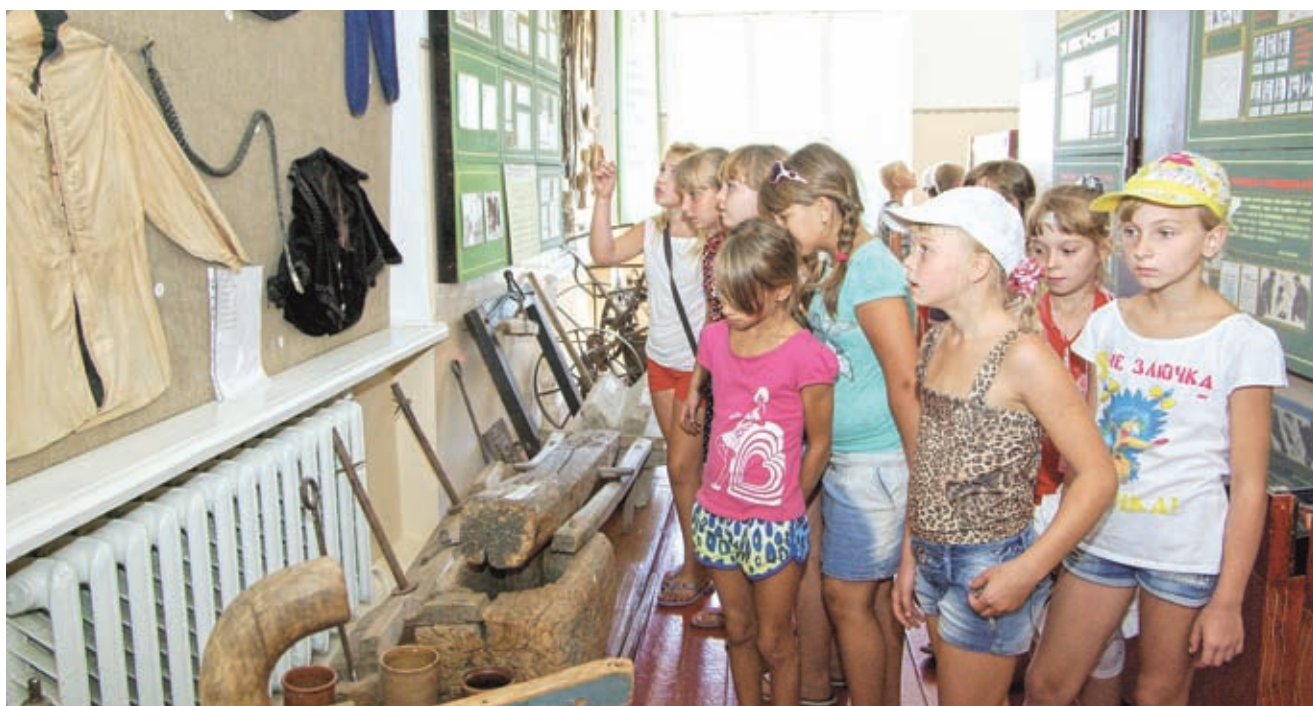
Основа станичного музея закладывалась в семидесятые годы прошлого века. Поэтому его экспозиции и поныне несут на себе идеологическую окраску тех лет

К началу гражданской войны Василий Михайлович уже был известен на всю Кубань как опытный подпольщик. Когда к власти пришли белые, он был оставлен в тылу для разведывательной и подрывной деятельности. Но удача отвернулась от него. Летом 1918 года Еременко и его помощник Иван Цимбал были схвачены у моста через речку на главной станич-