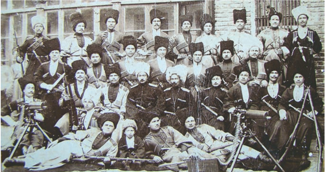
Теперь, когда посторонний экскурсант вглядывается в фотографии челбассовцев, выставленные на стендах музея, его обязательно поразит количество ярких, красивых лиц