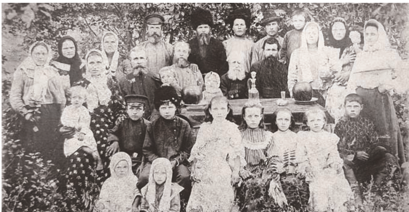
Появилась Челбасская на карте края позже других. Официально считается, что заложили ее в 1885 году. Но стоит послушать местных краеведов, как вырисовывается уникальная, не похожая на другие история этих мест