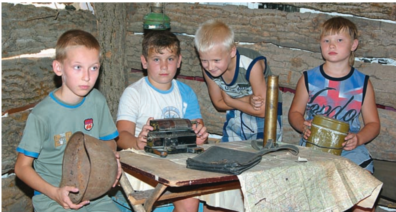
Познавшие горе и притеснения , они и к чужой беде более чутки. Но все-таки граница между своими и чужими иногда проходила по лезвию клинка. Ярким выражением этого стала история о челбасском казацком полковнике

Наконец войсковому казачеству удалось найти компромиссное решение, придав ситуации видимость законности. Кубанское войсковое правление сдало степи в аренду коммерче-