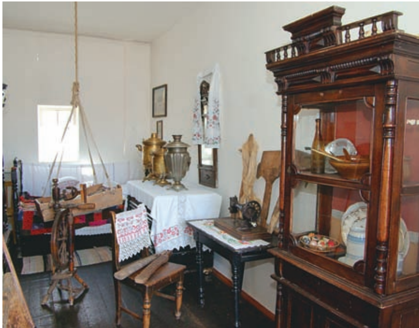
Станичная быль дарила сюжеты, которые могли бы стать основой увлекательного повествования о глубинных процессах эпохи

Но время брало свое. Некогда отсталая Кубань теперь производила на своих необъятных землях товарное зерно. Через Ейский морской порт оно шло даже за границу. Степь не могла пустовать. Невдалеке от разгромленной Дурноселовки начала быстро расти новая станица. Назвали ее Челбасской – по имени реки, на берегу которой она расположилась. Официальной датой возникновения станицы явилось 25 сентября 1885 года.