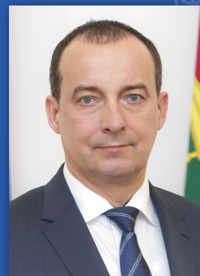
Председатель Законодательного Собрания Краснодарского края Ю. А. Бурлачко